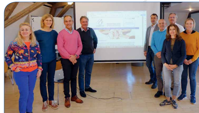
Gründungstreffen der Initiatorinnen und Initiatoren des EUBREAST Netzwerks im Klinikum Esslingen (November 2018).